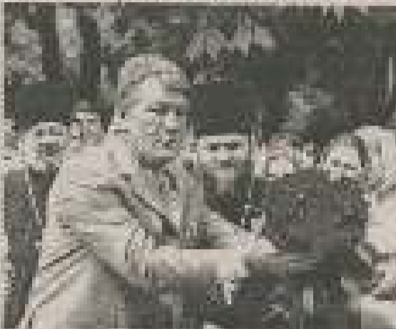
Президент В.А. Ющенко в Донецкой обл. январь 2005 года.

Как президент Украины вы стали для нас человекам примером. Не вступая в политику, вы стали для нас примером человека, который не ищет себе выгоды и не ищет себе славы. Вы стали для нас примером человека, который не ищет себе славы и не ищет себе выгоды. Вы стали для нас примером человека, который не ищет себе славы и не ищет себе выгоды.