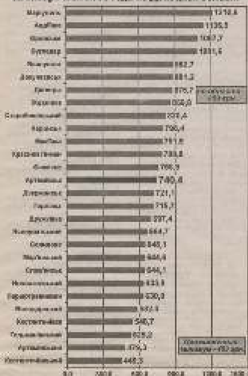
(Диаграмма №3) Среднемесячная заработная плата за январь-март 2005 года по Донецкой области