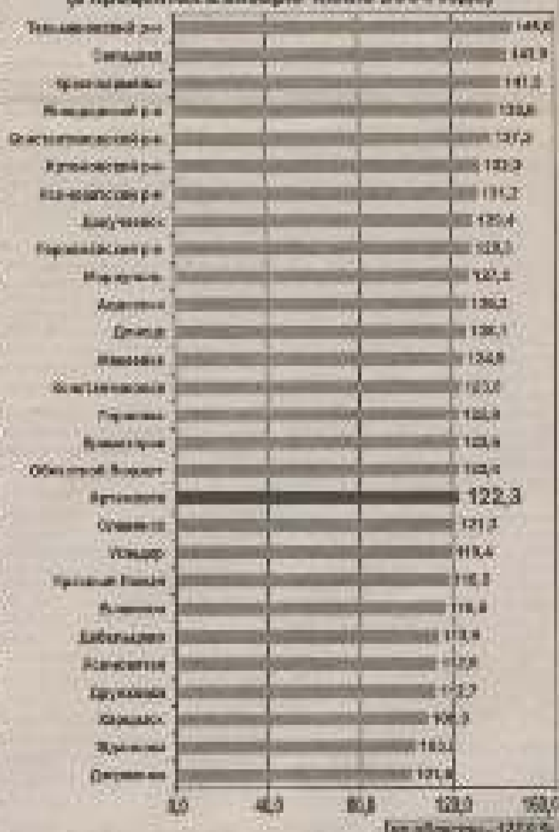
(Диаграмма №5) Поступления доходов общего фонда местных бюджетов за январь-март 2005 г. (в процентах к январю-марту 2004 года)