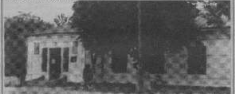
Приміщення колишньої Ярмолинецької єврейської школи, побудоване в 1932 році (фото 1990 року), смт Ярмолинець.

За матеріалами дослідження А. Р. Козака, наприкінці XIX ст. у кожній єврейській общині на території Поділля навчання дітей відбувалось у початкових школах релігійного спрямування - кедерах. Перша школа такого зразка з'явилась 1917 року у містечку Шарівка. У 1918 році за кошти єврейської соціалістичної партії "Бунд" відкрито початкову єврейську школу у містечку Ярмолинець.