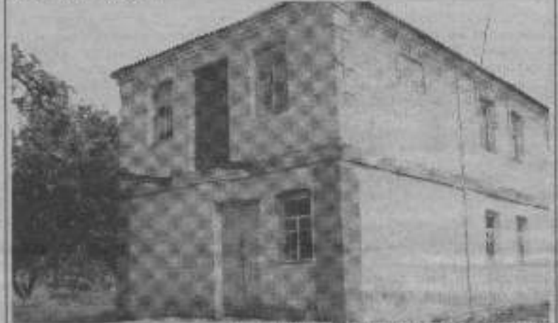
Приміщення колишньої Фрампільської єврейської початкової школи, с.Косогорка.

У 1924 році на території сучасного Ярмолинецького району функціонувало 5 навчальних закладів для дітей єврейської національності, а саме Ярмолинецька, Шарівська, Михайлівська (1921), Косогорська (1923) та Солобківська (1924) єврейські початкові школи.