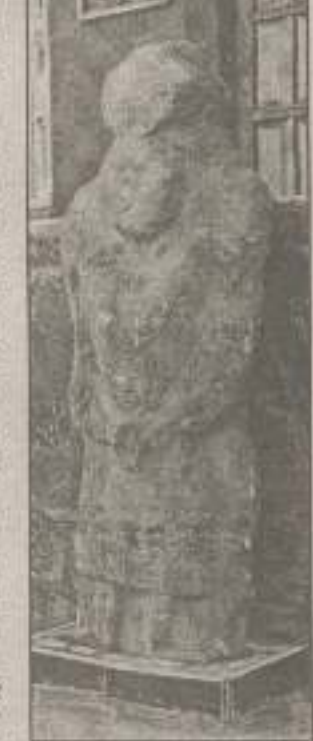
Знахідки археологів з мушкетерів роботи Миргородського краєзнавчого музею.