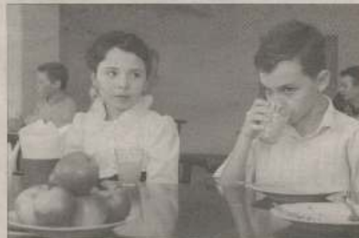
Во время рейдов специалисты СЭС проверяют соблюдение гигиенических норм и санитарного законодательства, а также организацию питания итальянцев

врач по гигиене питания отдела санитарного надзора Евпаторийского горуправления ГУ Госсанэпидслужбы в АРК.