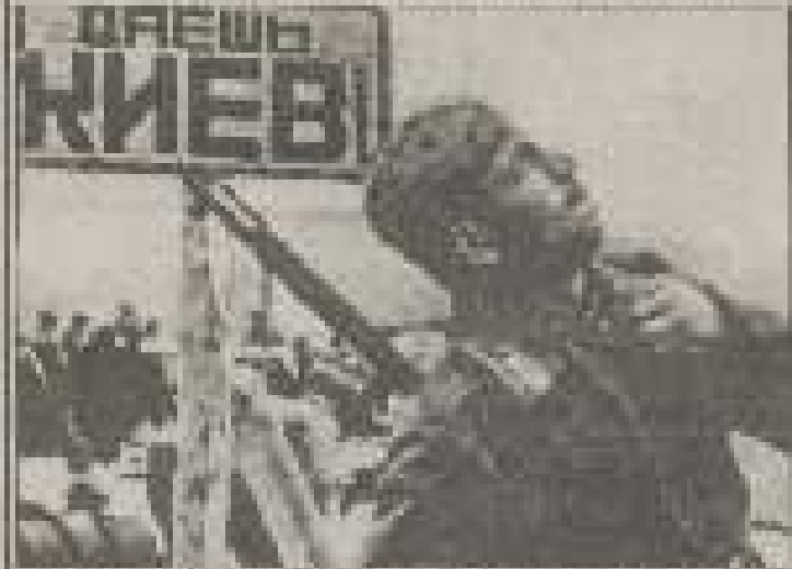
Влітку 1943 року під час війни українськими солдатами було встановлено пам'ятник у Києві на честь української армії, яка виступала під її знаменем.