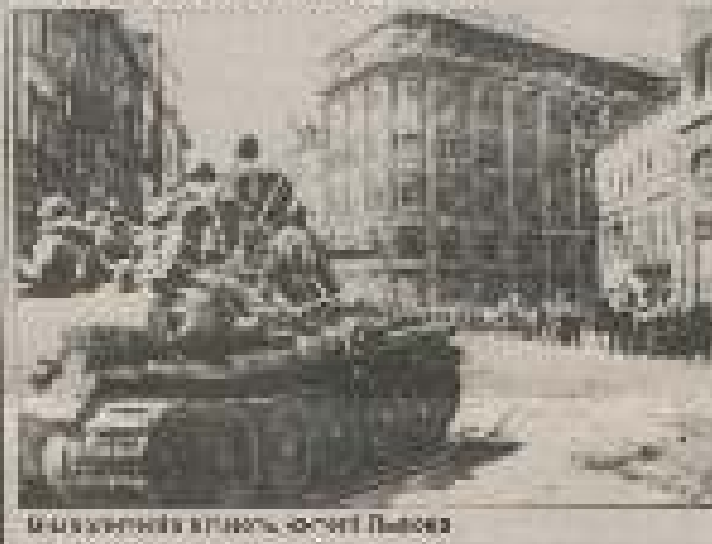
Місце зустрічі в місті Львів, 1945 рік.