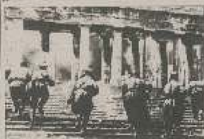
Штурманський офіс у місті Львів, 1945 рік.