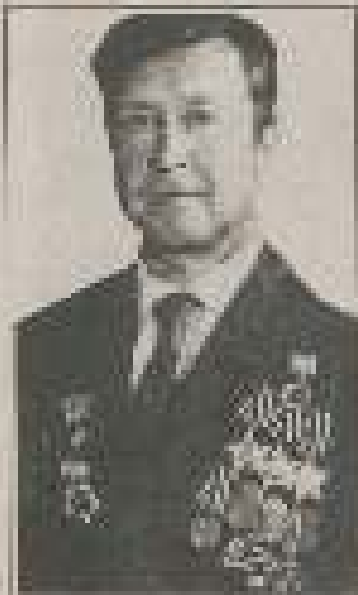
Дмитро Павлюк — командир бригади 128-го танкового корпусу 1-го Українського фронту. Після війни працював на різних посадах у Міністерстві оборони України.