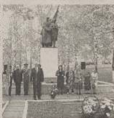
Пам'ятник на Білій горі

До цього пам'ятника приходять куп'янчани: школярі та студенти, і дорослі – вчителі та ветерани, щоб шанувати героїв-земляків, на долю яких випали найчорніші дні в історії рідного міста. На День Перемоги і День партизанської слави тут звучать урочисті слова, спогоди і клятви вірності. Квіти пам'яті легають до підніжжя постаменту, з якого радянський солдат і жінка-партизанка наче відносяться в наші душі.