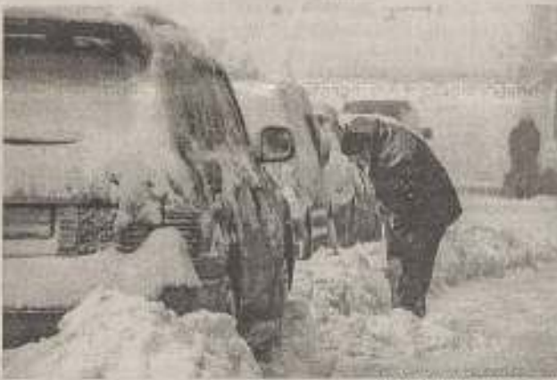
У снігових заметах

редження, – приписи. Коли виявляємо порушення благоустрою, то видаємо власнику – чи то підприємцю, чи власнику приватної садиби припис, вказуємо на виявлені порушення, встановлюємо строк усунення порушення.