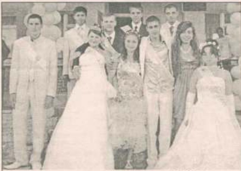
Ось вони - випускники Олексійського НВК 2009 року

навчатися. Порадяти своїй молодості на цьому святі побажали й ті, хто з а к і н ч и в Олексійську школу 25, 30, 40 і 50 років