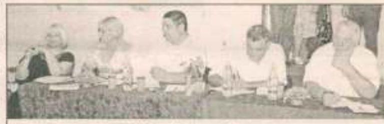
Журі за роботою

були не те що “кавеєнішими”, а й улюбленими публіки. Погляди на різні сторони життя податківців були незаштампованими – від апарату і