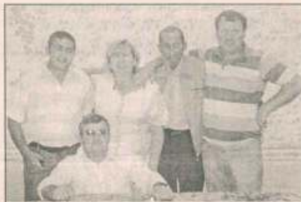
Останні "25-річні" випускники зі старої Олексійської школи

вигукнула вона. - І з превеликим задоволенням поділю душею шем з усіма.