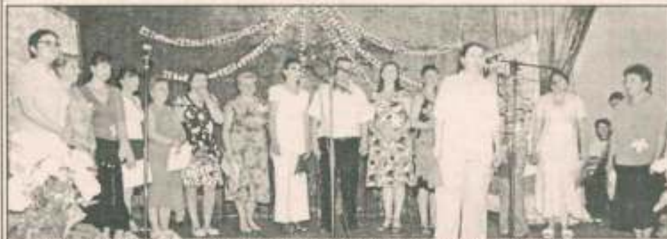
Виступає команда управління праці та соціального захисту населення

від управління праці та соціального захисту населення. Третіми кмітливими й винахідливими були податківці.