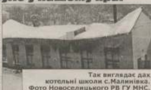
Так виглядає дах котельні школи с.Малинівка.

— Цьогоріч зима додала клопотів райавтодорівцям. Починаючи з 6 і до 15 лютого, наші працівники трудилися цілодобово — забезпечити нормальний стан доріг. Для того, щоб вивести район зі "сніжного полону"