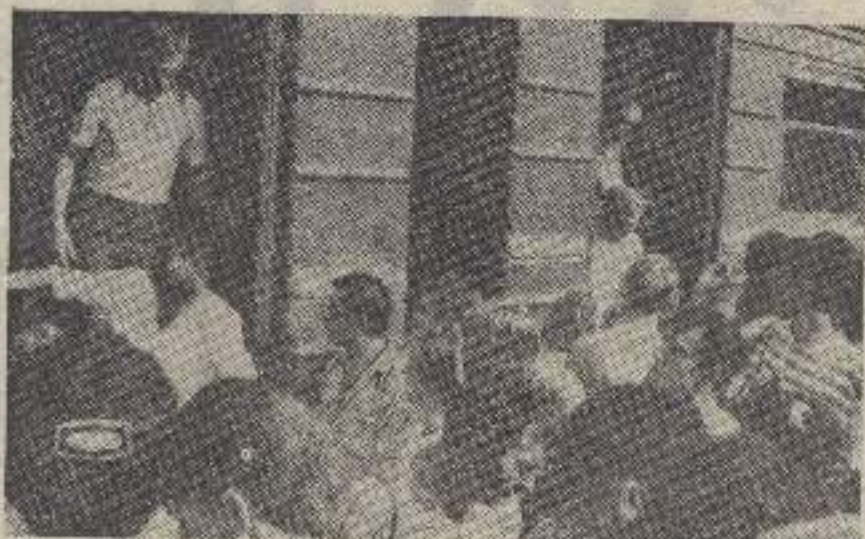
Город в объективе