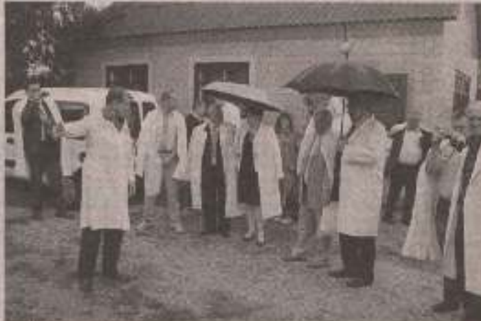
У ході навчання на початку квітня цього року до виробничих об'єктів, у тому числі МТФ ПП «Олександрівка», за наявності необхідності було встановлено контрольні-контрольні пункти. Цьому потропили до МТФ, на який здійснюється контроль за виконанням БРХ з територією на сибірську територію у ПП «Олександрівка».