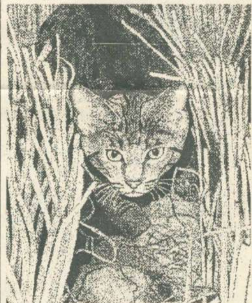
Малюнок Тетяни ОКАЛЬСЬКОЇ-СТАНГРЕТ.