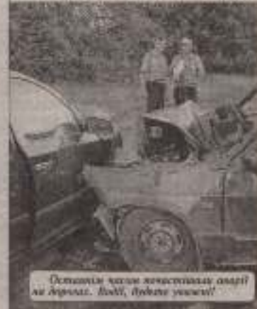
Останнім часом інтенсивно працює на Аверс. Діти, будують умови!

Колегія виконавчих відділення ВДСРБ в Шумському районі спеціалізується на виготовленні БРХ та коней. Адреса: с. Кутинка, тел.: 37-3-67, 098783-41-05.