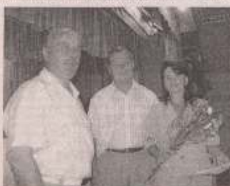
поблизу і пафарбували жовту яскраву нічкату блондою і подарили школі.