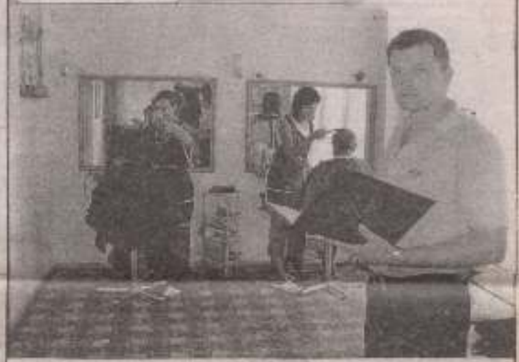
Перше надія вересня – День підприємця