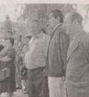
Присми-с, що на сцені були не тільки працівники культури, а й військи, діти, пенсіонери, сільські ініціативні люди, які єдині патентованою того, що тільки сільсько-господарський, з урахуванням правих можна карпати сім'ю хвалити того, зміцнити добробут нашої держави.

Закінчилося засідання коллегії райдержадміністрації та сільської ради з урахуванням соціальних ініціатив Президента України Віктора Ющенка. Сільська рада отримували гарну концертну програму.