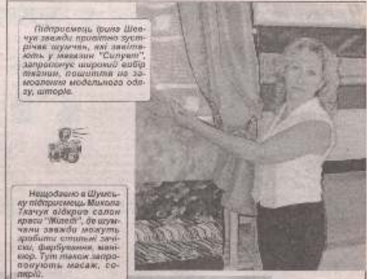
Підприємство група Шумська завжди провітливо зустрічає шумщани, які завітують у магазин "Силван", запрошують широкій вибір товарів, поважають на задоволення модального образу, штурма.