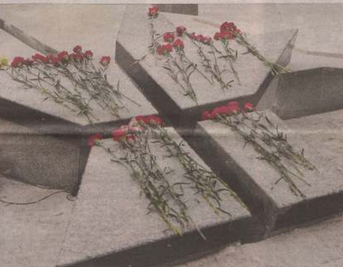
Вчера, 15 февраля, у памятника погибшим воинам-афганцам состоялся торжественный митинг, посвященный Дню чествования участников боевых действий на территории других государств и 23-й годовщине вывода советских войск из Афганистана.

В митинге у Мемориала памяти погибшим в Афганистане при поддержке Харьковской городской рады участвовали Кабинет министров Харьковской области, государственная администрация Михаила Добкина.