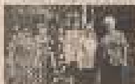
Медики в спеціальній формі.