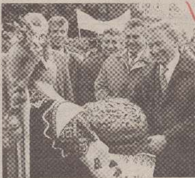
На знімку: теїла зустріч Президента Л. Д. Кучми на тернопільській землі.

Наступного дня Президент побував у Підволочиському і Збаразькому районах.