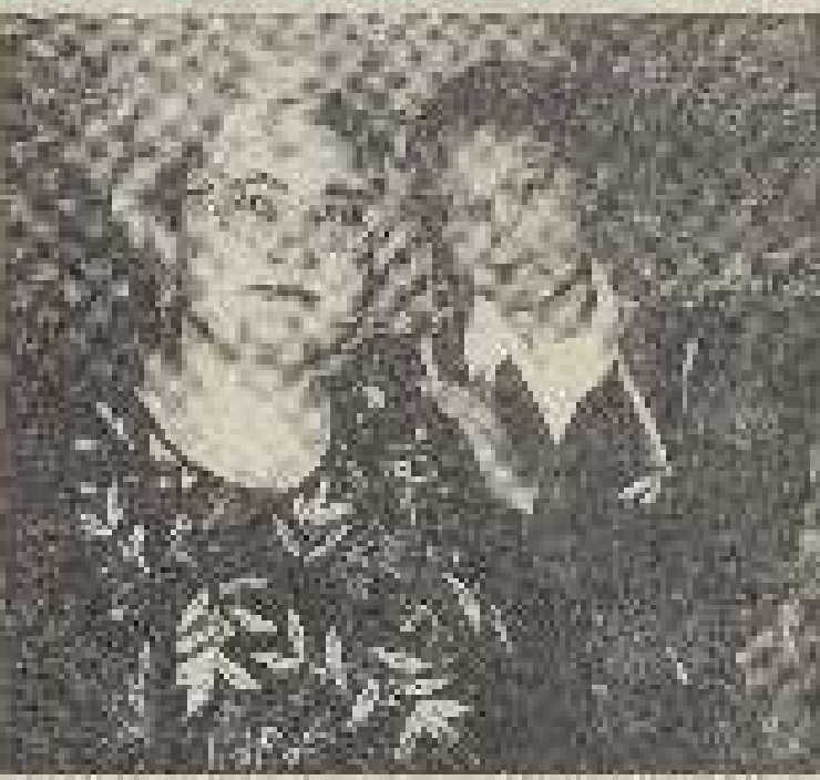
Галінка... Галінка... Галінка...