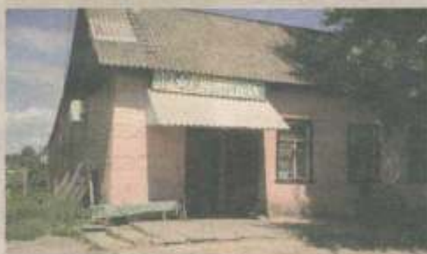
Кафе «Раманка» у Кодні - місце конфлікту.