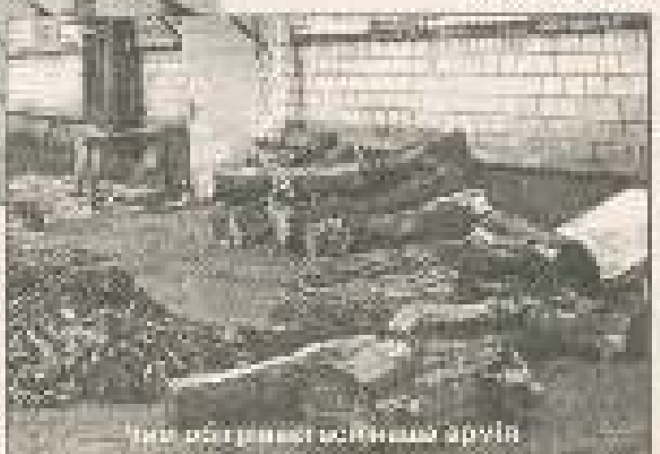
...вона була б... ми всі повинні бути готові до того, щоб захищати свою країну. Але сьогоднішня ситуація в Україні зовсім інша.