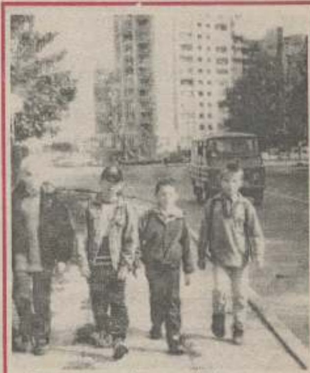
Для них щасливий завтрашній день...

У цьому документі, повідомляє «Інтерфакс-Україна», зокрема обґрунтовуються перспективи європейської інтеграції нашої країни, затвердження в країні соціально-орієнтованої, структурно-інноваційної системи розвитку.