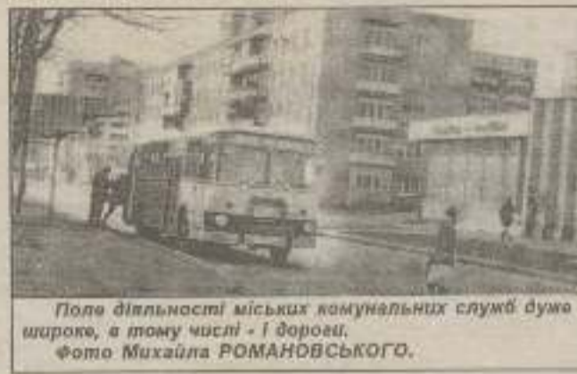
Поле діяльності міських комунальних служб дуже широке, в тому числі - і дорожнє.

На нараді зобов'язали керівників розробити заходи щодо проведення загальноміської толоки.