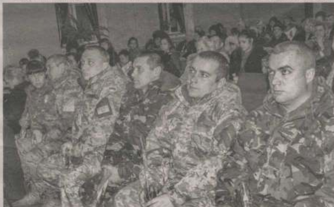
Почесні гості урочистостей - учасники АТО на сході України під час урочистостей в Остерському МБК.

діяльності районного будинку культури, виконавці Козелецького будинку творчості дітей та юнацтва, а також дитячі хорео-