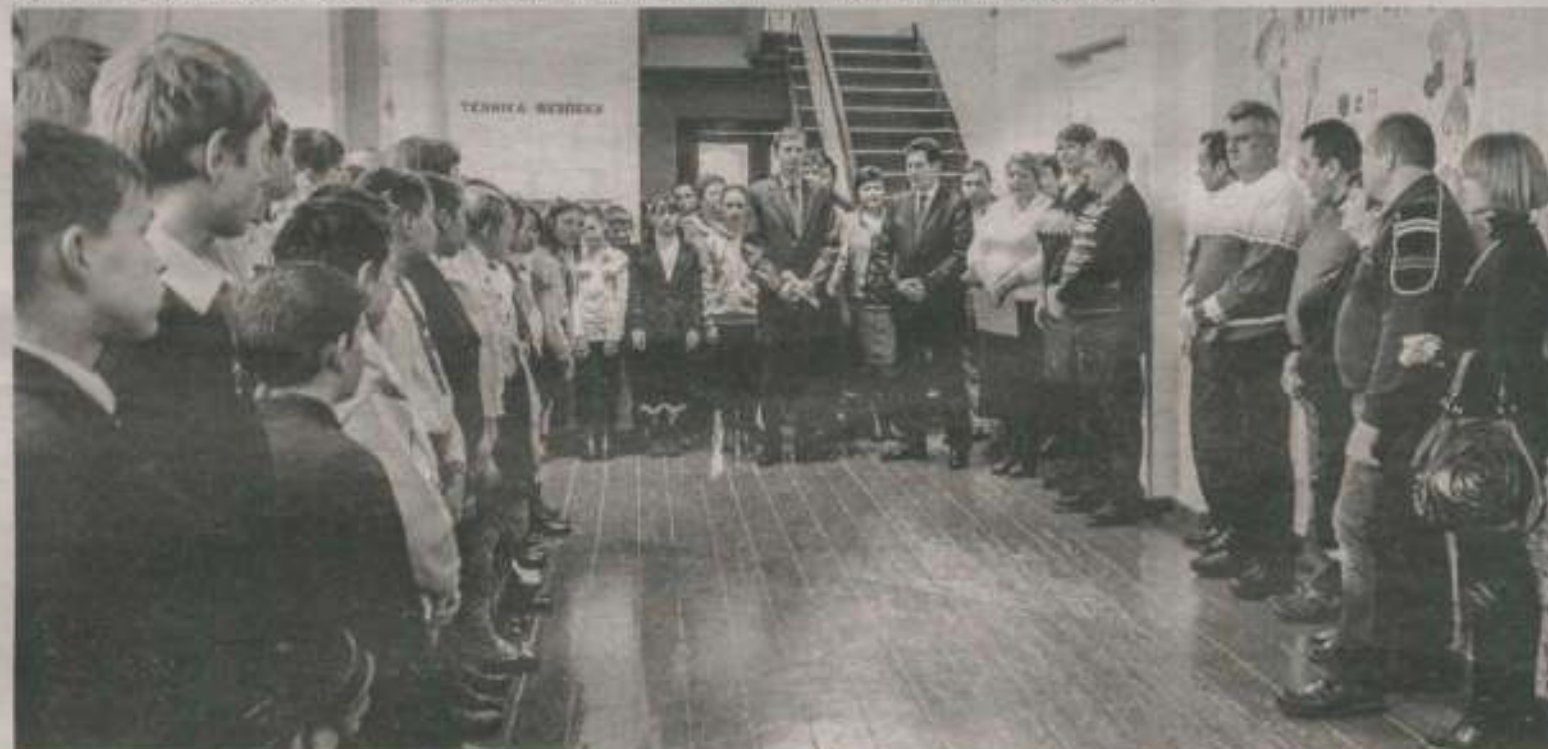
Під час урочистої лінійки в Сираївській ЗОШ І-ІІІ ст.