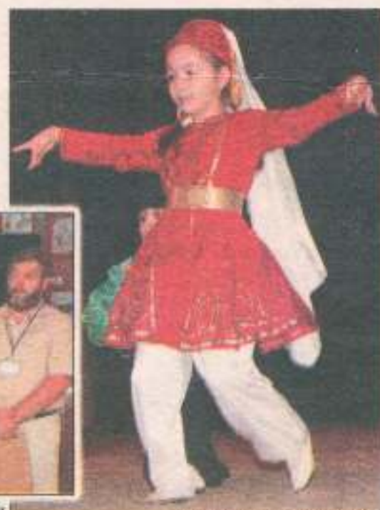
Надежды и перспективы национального общества - его дети.