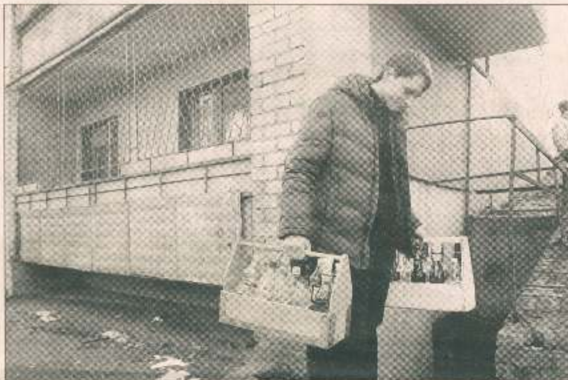
Воду на проверку отбирали в присутствии журналистов и специалистов КП «Жилмассив».

27 декабря 2011 г. представители КП «Водоканал» в присутствии журналистов, сотрудников КП «Жилмассив» и старшей до-