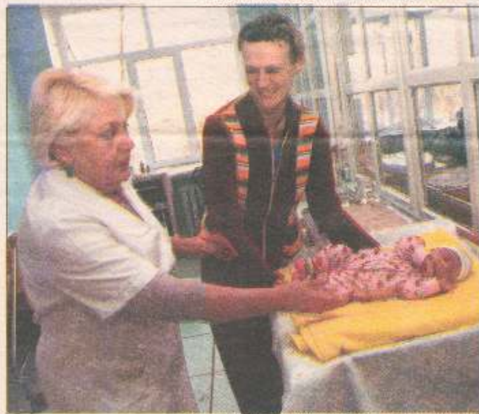
Медсестры учат мам ухаживать за новорожденными.

Татьяна ОКСАМИТНАЯ, «МВ».