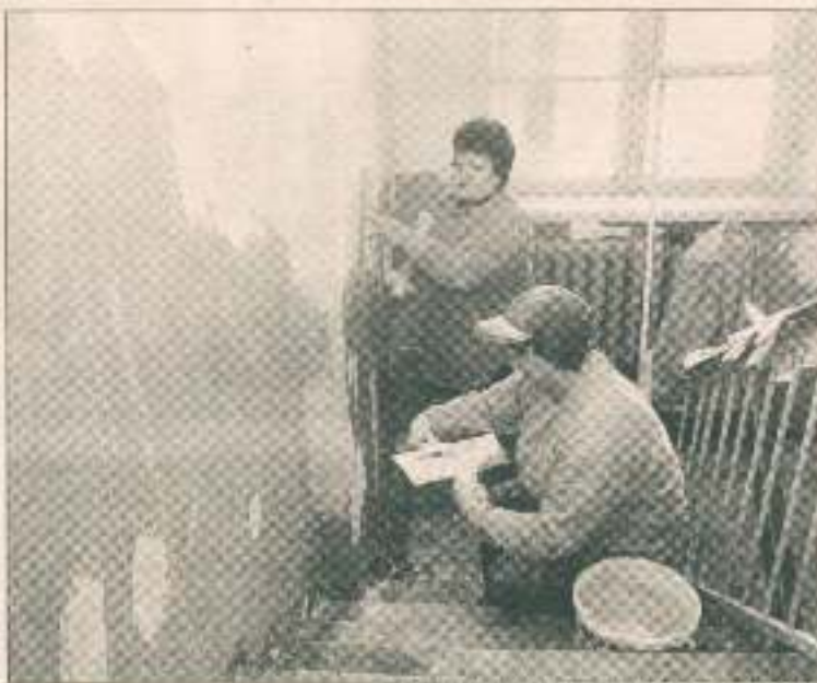
В эти дни ремонт подъезда ведется в доме № 37 по пр. Б. Хмельницкого.

на год работ в жилом фонде удалось выполнить, а какие нет и почему?