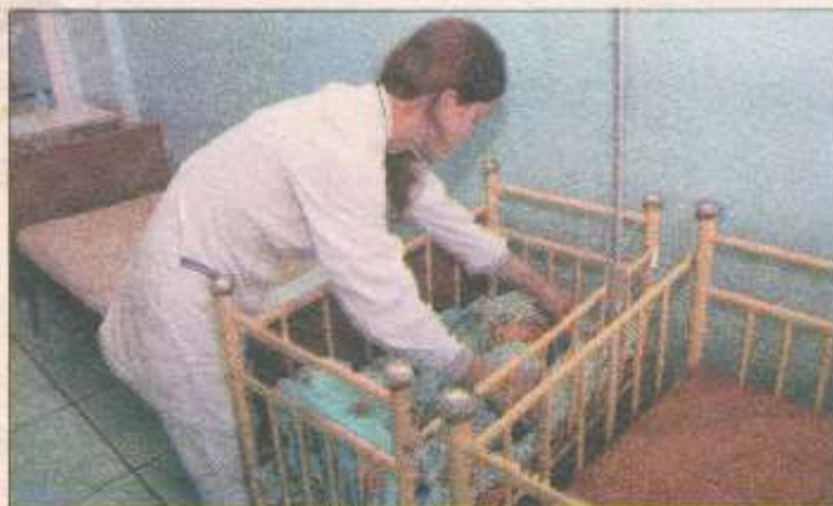
В отделении ОПН дети и мамы находятся вместе.