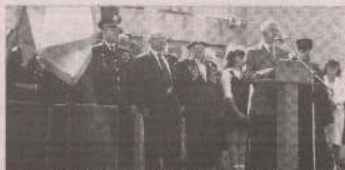
Мітинг на центральному майдані Горностайки, в якому взяли участь керівники району, селища, ветерани, представники духовництва та молоді