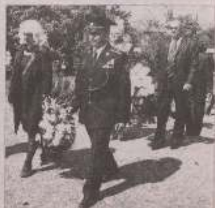
Каріємики підприємств і мешканці районцентру покладуть квіти до пам'ятних місць