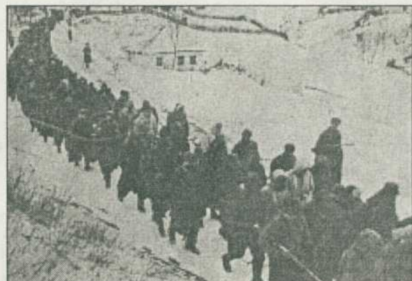
Колона полонених німецьких військ після Корсунь-Шевченківської операції.