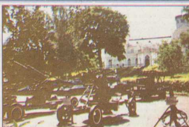
Біля музею на майданчику радянської військової техніки періоду Великої Вітчизняної війни.