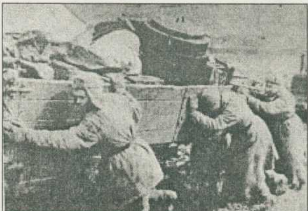
В умовах бездоріжжя під час битви.