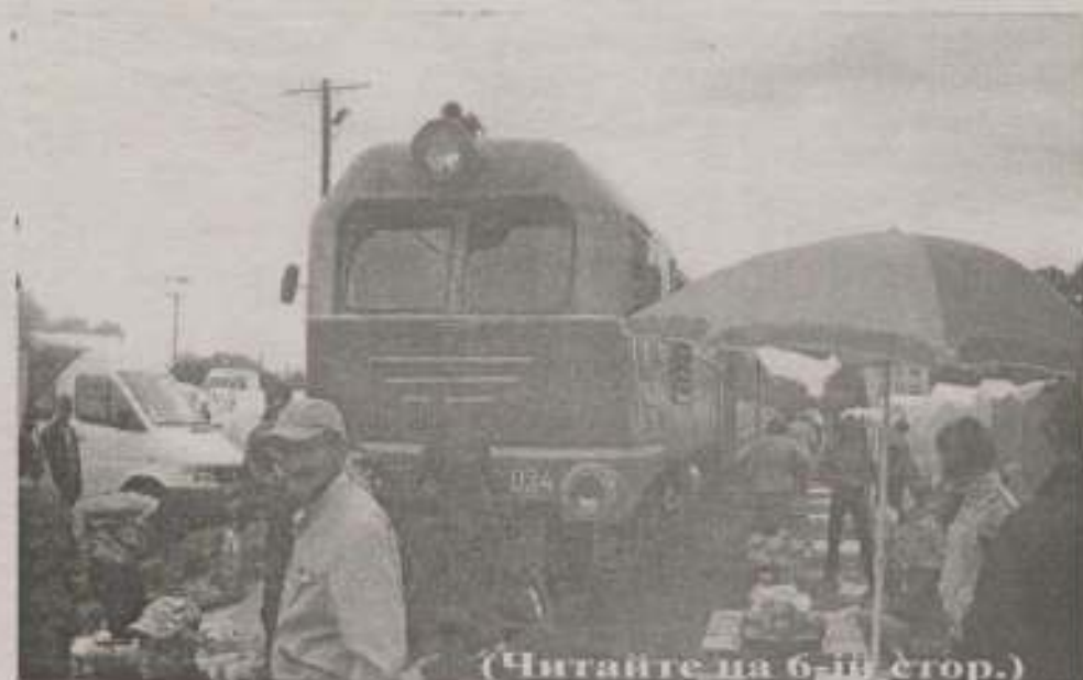
(Читайте на 6-й стор.)