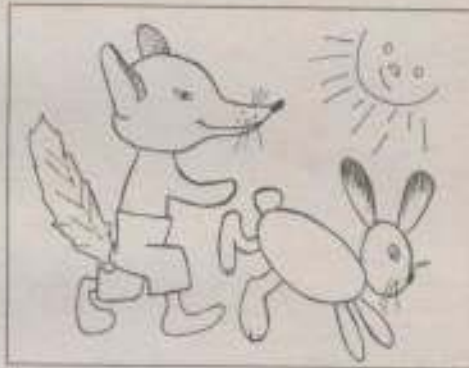
А Зайчик всі такі. Це Лисички нічні виходять на полювання і нічого не бояться. А Зайчики в темноті повинні ховатися від своїх ворогів. І ніхто цього вже не змінить.

Лисичка ніяк не могла згоропати, що з її другом.