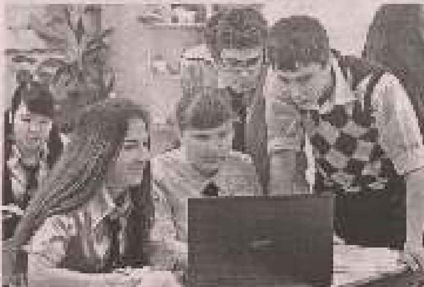
Важливо зауважити, що цей закон вступив в силу не відразу, а лише після закінчення терміну дії ліцензій, виданих до набрання чинності нового Закону про освіту.