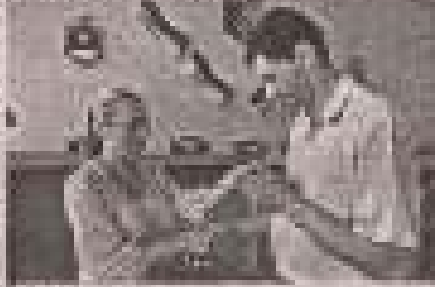
Відзначення учасників АТО.

Відзначення учасників АТО є важливою подією, яка допомагає їм відчути підтримку та увагу суспільства. Крім того, це є нагадуванням для громадян України про те, що вони не забувають про тих, хто захищає їхню Батьківщину. Тому заходи з відзначення учасників АТО є важливими для українського суспільства.