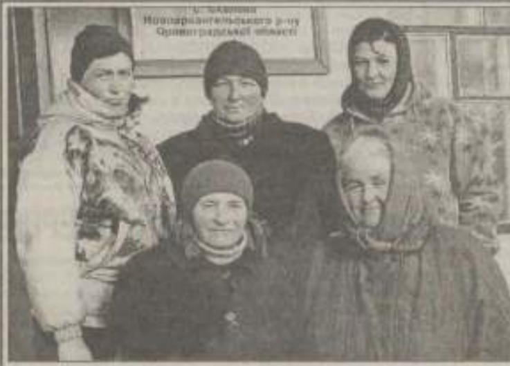
Учасниці Новоархангельського району Орнітологічної команди

Новий рік для цих жінок не лише сімейне свято, де в родинному колі за святковим столом можна порадіти, поспілкувати, пошрияти. Новий рік це можливість підсумувати трудові здобутки. А вони у працівників СВК «Вісь» цього року вагомі.