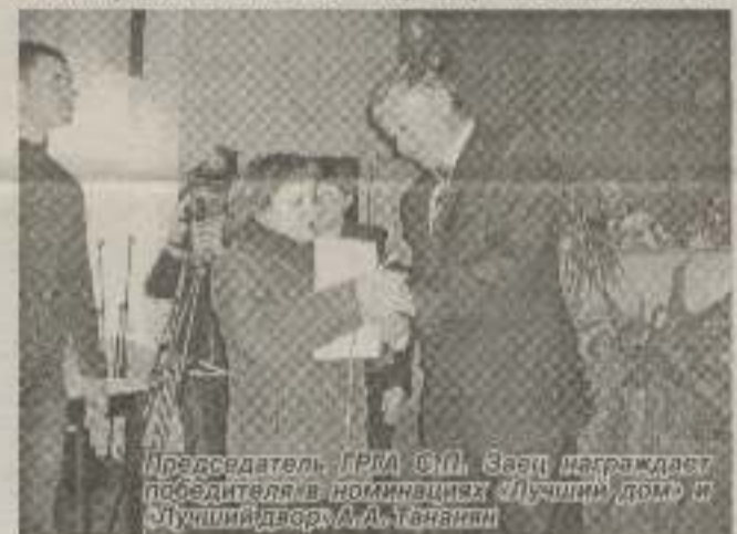
В 15.00 празднование 32-й годовщины со дня образования Гагаринского района было продолжено открытием районной Доски Почета.

В честь Дня рождения Гагаринского района состоялось возложение корзины цветов к памятному знаку «Человек и космос».