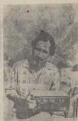
«ДВМ» УСІМ ПОТРІБНИЙ

Чекасмо ваших листів, дописувачі газети «Життя і слово».